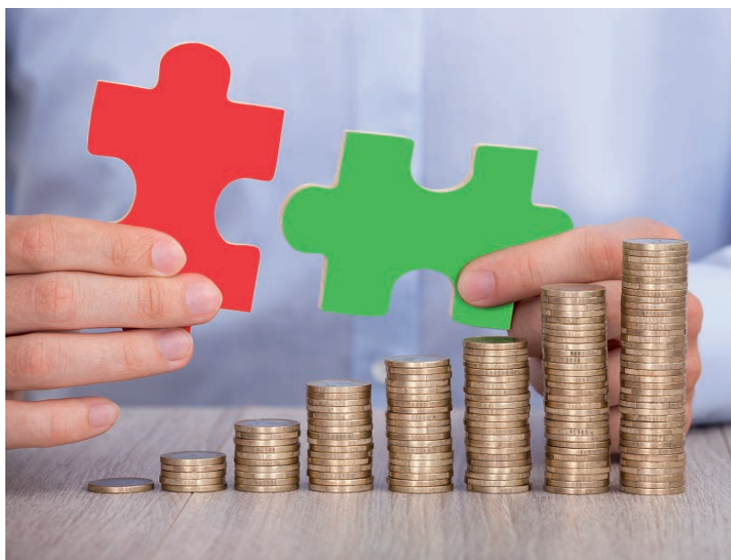
Rumoer rond bijheffing

Aan de Tweede Kamer is toegezegd dat belastingplichtigen vier maanden extra de tijd krijgen om de naheffing te betalen. Die extra vier maanden komen bovenop de gebruikelijke betalingstermijn van zes weken. Daardoor zal volgend jaar pas na een periode van 5,5 maand rente in rekening gebracht worden.