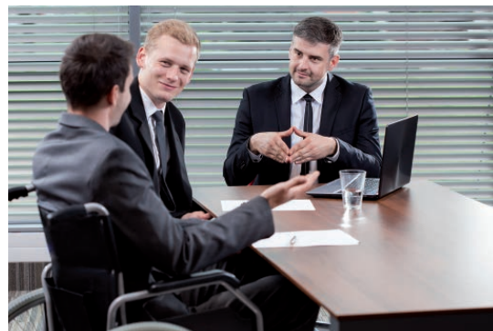
Betere stroomlijning aannamebeleid gehandicapten

Het is één van de kroonjuwelen van staatssecretaris Jetta Klijnsma van Sociale Zaken; het creëren